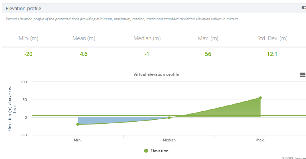
Gráfico 2. Perfil de elevación virtual del área costera protegida del Parque Nacional de Banc d’Arguin (Mauritania). La topografía por debajo del nivel del mar se destaca en azul.

Es probable que las áreas protegidas con una topografía compleja y una mayor variabilidad climática sean más resilientes a los cambios climáticos, pero también pueden requerir más recursos para la gestión que aquellas con un entorno más homogéneo.