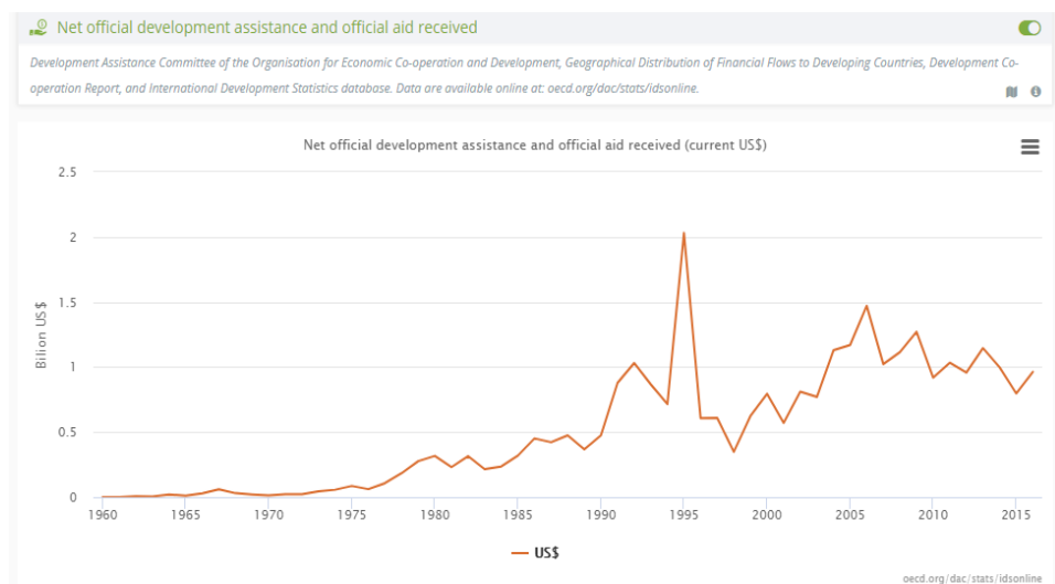
Gráfico 2. Captura de pantalla de la evolución de la ayuda al desarrollo (en USD) en DOPA Explorer facilitada por el Banco Mundial